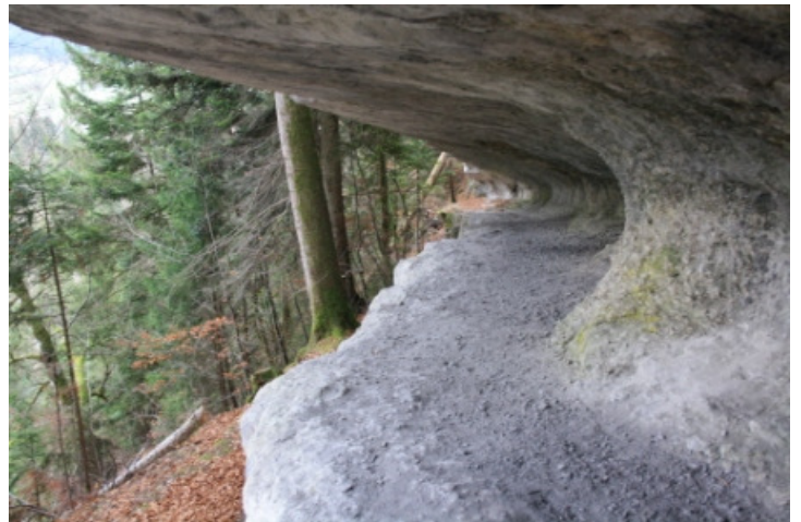
Le corridor au loup