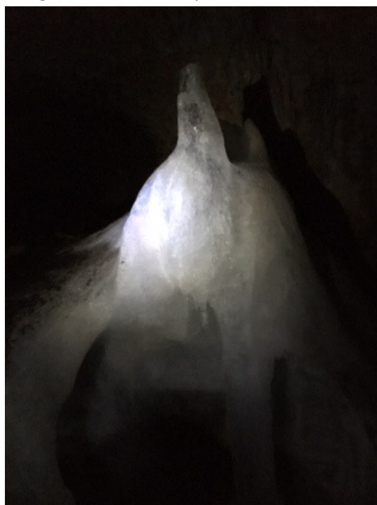
La glacière de Monlésy