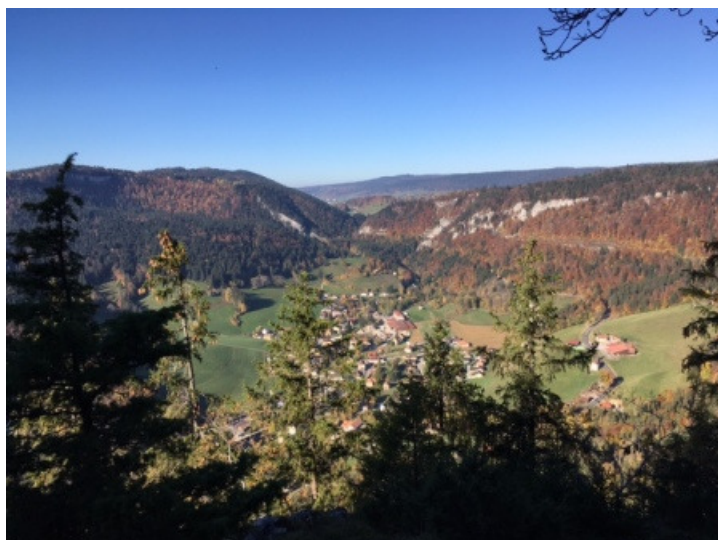
Saint-Sulpice / Verrières