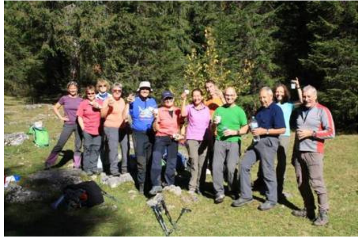
Les marcheurs Sections Amies