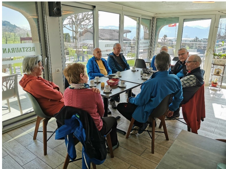
Une bonne bière après l'effort