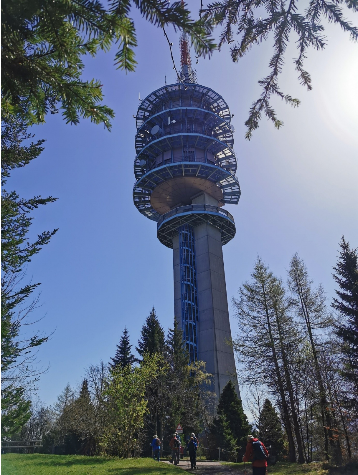
Tour Gibloux alt. 1205 m - 185 marches jusqu'au 1 er étage